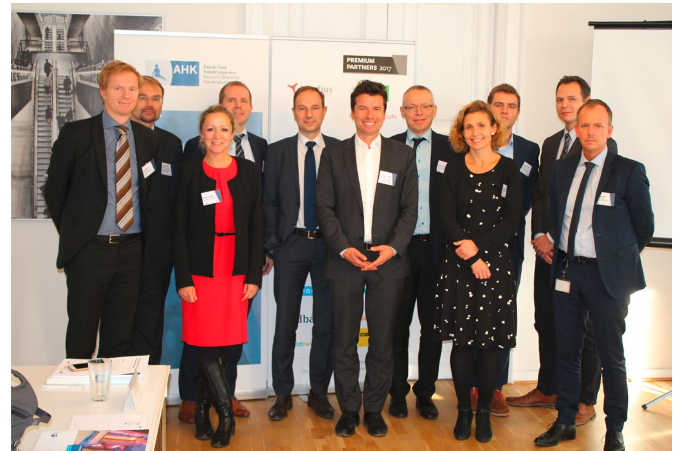
Vetreter aus Bayern und Dänemark diskutierten über aktuelle Herausforderungen in der Energiewirtschaft

Mit dem energiepolitischen Dialog setzt sich der BIHK bereits seit 2015 für einen Austausch zwischen führenden europäischen Wirtschaftsregionen ein. Erklärtes Ziel des Dialogs ist es, zu einer besseren Abstimmung nationaler Politiken auf diesem Gebiet beizutragen. Für die bayerischen IHKs ergibt sich durch den direkten Austausch mit der Brüsseler Politik eine zusätzliche Möglichkeit, die Anliegen Bayerns zu kommunizieren und konstruktiven Einfluss auf EU-Entscheidungen zu nehmen.