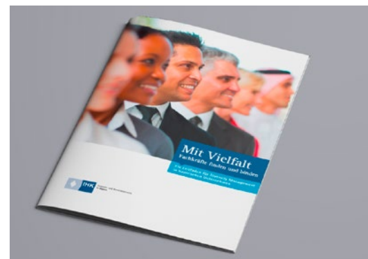
BIHK-Leitfaden für Diversity Management

150 Veranstaltungen mit 6.600 Teilnehmern