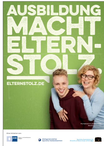
Kampagnenmotiv Ausbildung macht Elternstolz