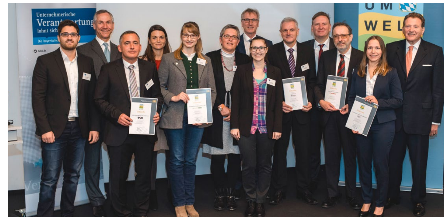
Vertreterinnen und Vertreter der am Umweltpakt-Pilotprojekt beteiligten Unternehmen

90 Verfahren vor der Einigungsstelle für Wettbewerbsstreitigkeiten