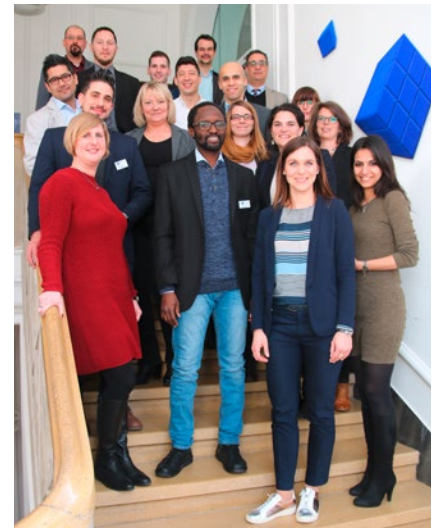
Die Integrationsspezialisten der IHKs in Bayern beraten und begleiten die Unternehmen und Geflüchtete zu allen Fragen rund um Ausbildung und Beschäftigung.