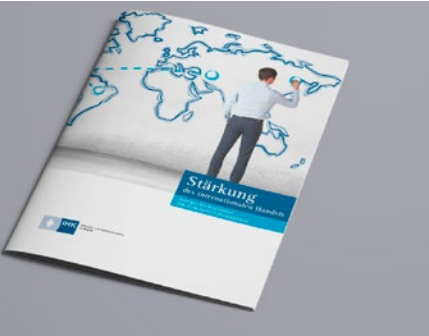
BIHK-Broschüre zum Thema „Stärkung des internationalen Handels“