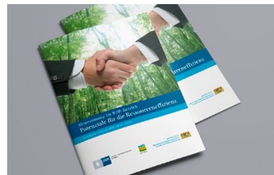
BIHK-Studie: Shareconomy im B2B-Bereich – Potenziale für die Ressourceneffizienz