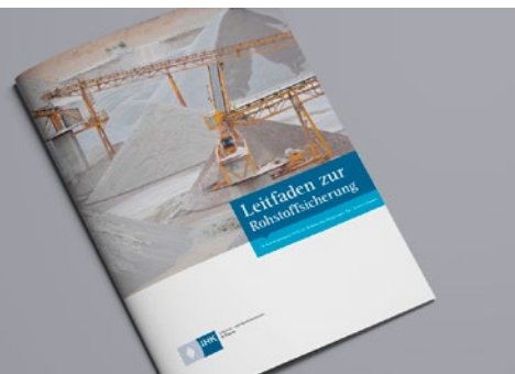
BIHK-Leitfaden zur Rohstoffsicherung

Mit einem neuen Leitfaden informiert der BIHK bayerische Unternehmen zur Planung und Genehmigung von Abbaustandorten für heimische Rohstoffe. Gleichzeitig werden Empfehlungen an die Verwaltung und Politik ausgesprochen, um die Gewinnung heimischer Rohstoffe besser zu unterstützen. Heimische Rohstoffe sind das Fundament der bayerischen Wirtschaft und werden unter anderem für den dringend notwendigen Wohnungsbau in der Metropolregion München wie auch für überregionale Infrastrukturprojekte benötigt. Daher kommt der langfristigen Sicherung heimischer Rohstoffe, insbesondere Steine und Erden, eine herausragende Bedeutung im öffentlichen Interesse zu.