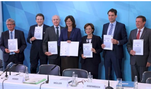
Staatsministerin Ilse Aigner mit den Unterzeichnern des Pakts für Berufliche Bildung