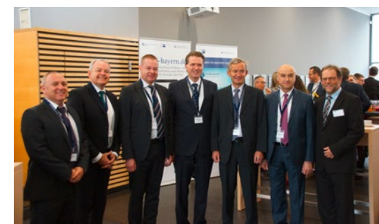
Ost-West-Forum Bayern 2017 in der IHK Regensburg für Oberpfalz/Kelheim

590.000 legalisierte Ursprungszeugnisse, Handelsrechnungen und sonstige Bescheinigungen