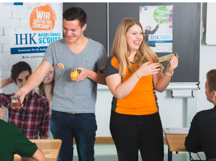
Aus erster Hand: IHK AusbildungsScouts informieren Schüler über die duale Ausbildung.

Um gemeinsam wieder mehr junge Menschen für eine duale Ausbildung zu gewinnen, stellen die IHK AusbildungsScouts ihre Berufe in Vorabgangsklassen allgemeinbildender Schulen vor. Sie besuchen Schülerinnen und Schüler und berichten über den eigenen Weg zum gewählten Beruf, die Ausbildungsinhalte, den Tagesablauf und die Möglichkeiten nach dem Abschluss. Sie beantworten die Fragen der Schüler und helfen ihnen damit bei der eigenen Berufswahlentscheidung. Die bayerischen IHKs führen das vom Bayerischen Staatsministerium für Wirtschaft, Energie und Technologie geförderte Projekt gemeinsam durch. Ziel ist es, wieder mehr junge Menschen für eine duale Ausbildung zu begeistern.